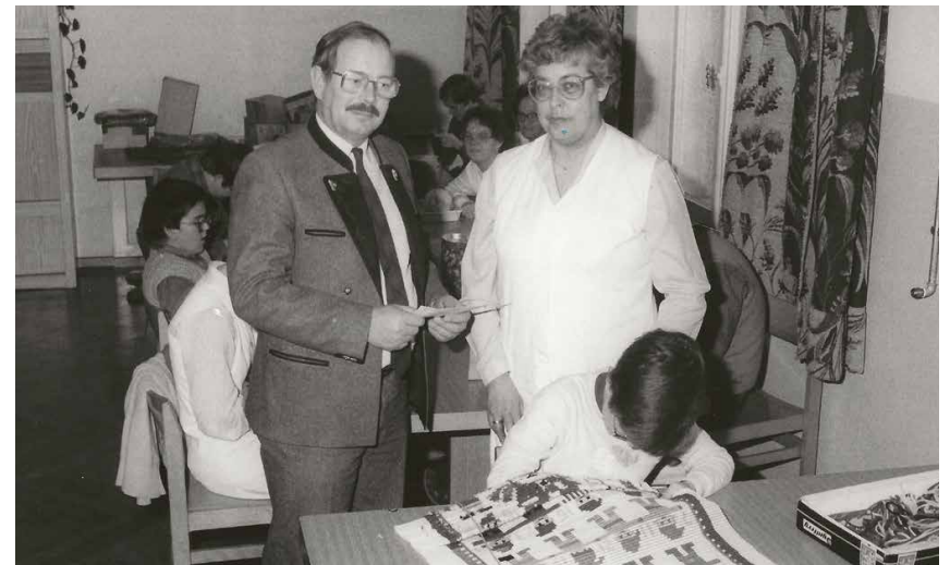
Scheckübergabe Lebenshilfe 1985