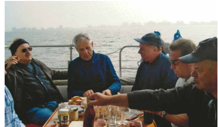
Herrentörn 2006

Die 2000-er Jahre waren geprägt von einem regen Vereinsleben und zahlreichen Festivitäten. Den Auftakt machte das Stegfest im Jahr 2000 mit Eröffnung der Mooringanlage. Der Meeresherr Neptun in prächtigem Gewand war in diesen Jahren oft im Einsatz, galt es doch, viele neue Motorboote im Hafen nach alter Tradition zu taufen! Ab 2016 zählte auch die Seeputzpatze zu den fixen Programmpunkten beim MBC. 21