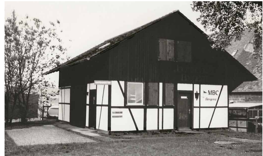
Unser Clubheim in den Achtzigern