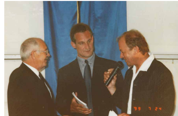
Feier des 25-Jahr-Jubiläums 1999