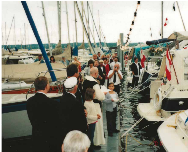
Eröffnung Mooringanlage 2000