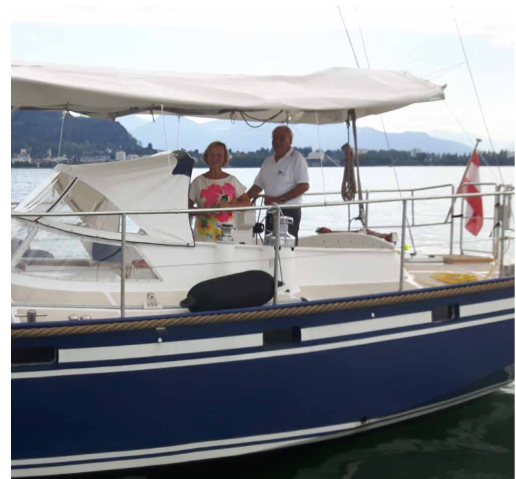
Abkurbeln 2020

Die Zeit der Covid-19-Pandemie waren auch für den MBC eine große Herausforderung. Der neue Pächter konnte erst am 15. Mai 2020 in die Saison starten, das Ankurbeln fand sogar erst am 12. Juli (!) statt! Viele Veranstaltungen mussten abgesagt werden. Trotzdem blieb der Vorstand des MBC nicht untätig: Der Vereinskalendar erfuhr ein neues Layout und die neue Webseite ging in diesem Jahr online! Danach nahm das Vereinsleben wieder richtig Fahrt auf, bei dem das gesellige Miteinander im Clubheim gefeiert werden konnte. 23