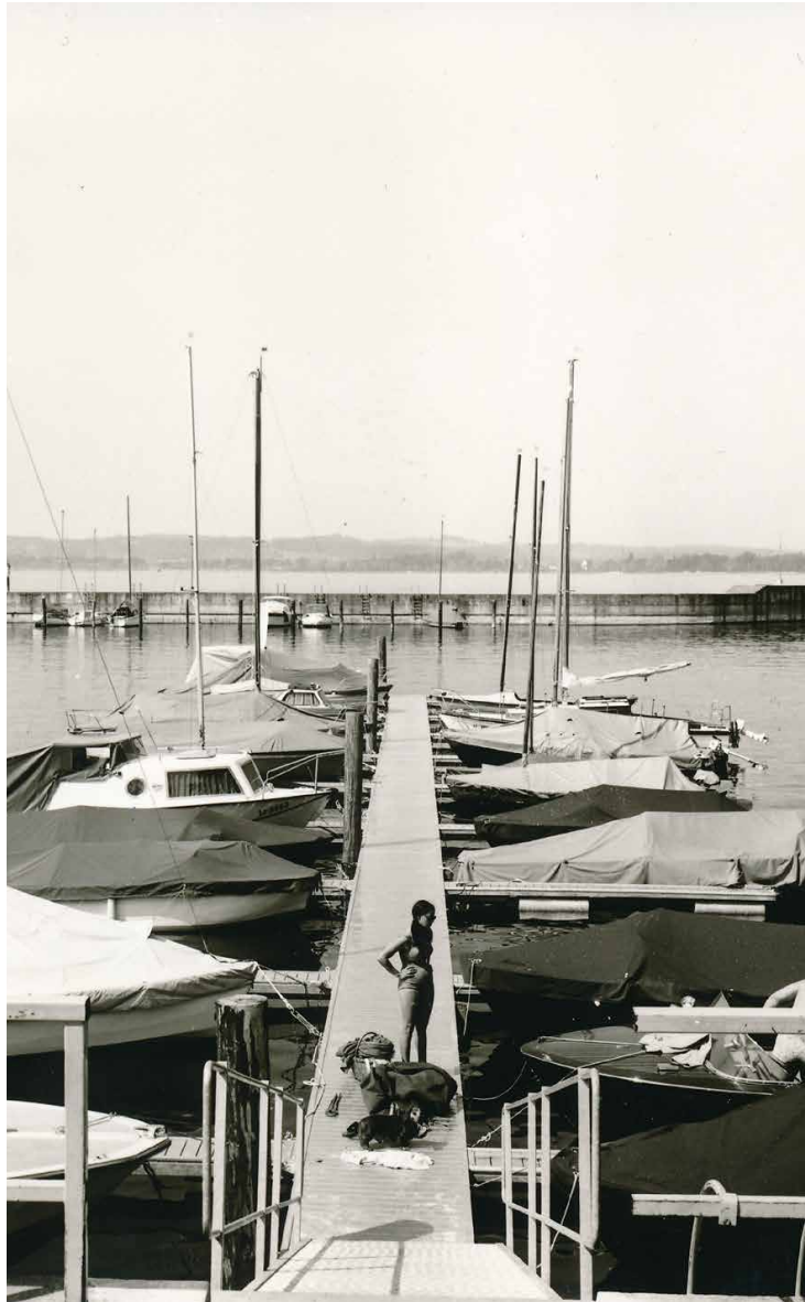
Neuer Bootssteg 1972