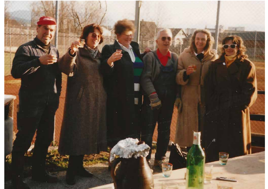
Firstfeier Clubhaus 1987

Bis 1986 wurde das Clubheim nur für Vereinszwecke genutzt, bis schließlich der Startschuss zum Neubau fiel. Konzept und Planung übernahm das Baumeisterbüro Much Untertrifaller. In unglaublichen 15.584 Arbeitsstunden in Eigenregie leisteten die Clubmitglieder einen riesigen Beitrag! Großzügige Sponsoren statteten das anfangs einfach ausgestattete Häuschen aus, die Gattinnen einiger Mitglieder übernahmen die Bewirtung bis das Wirte-Ehepaar Maurer die Gastronomie übernahm und mit einfachen, aber schmackhaften Gerichten aufkochte. 17 18