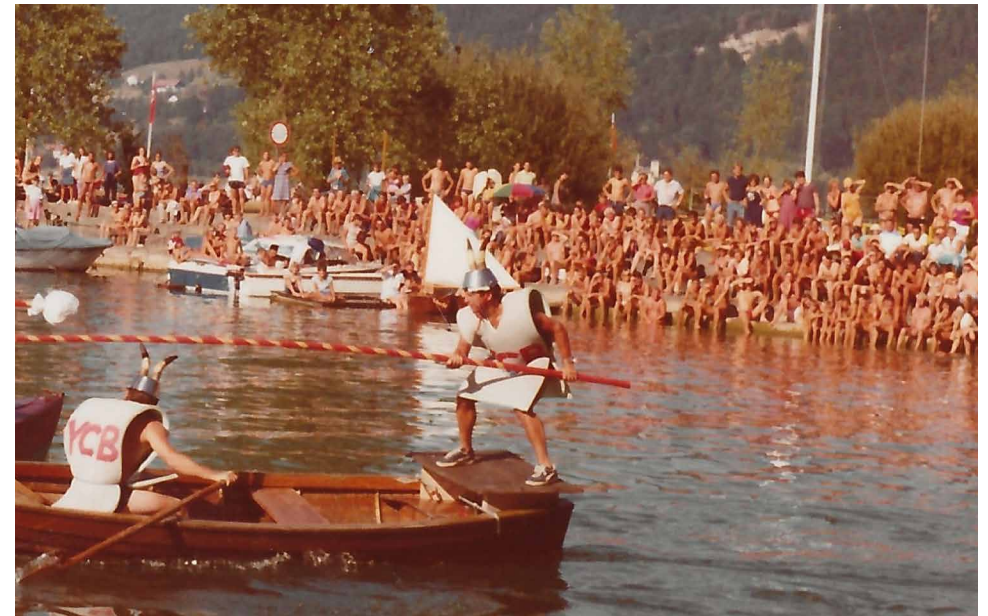
Wasserritterspiele 1983