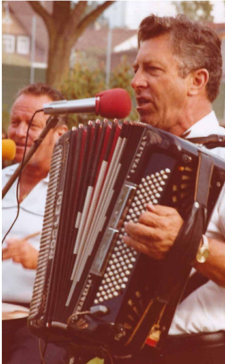
Die musikalischen Willis 1980