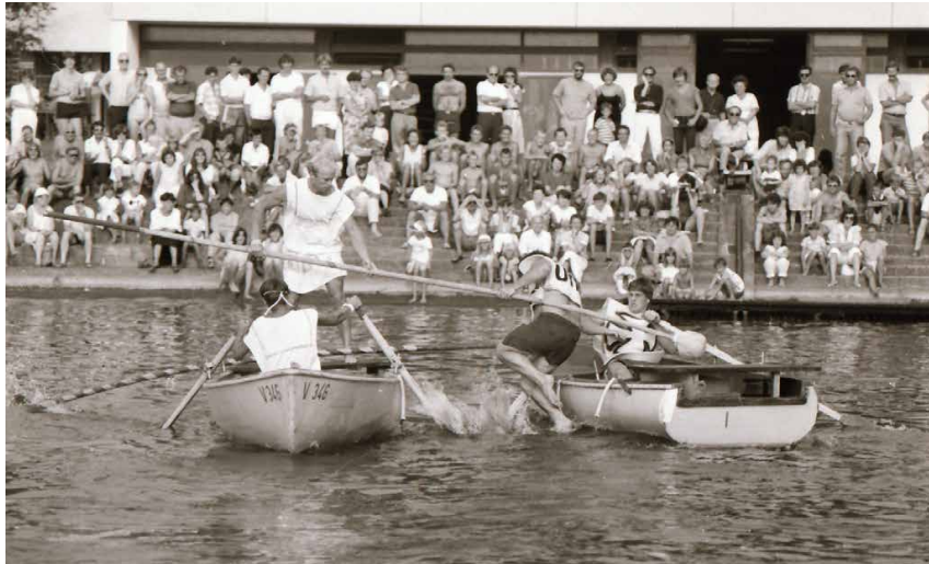
Wasserritterspiele 1985