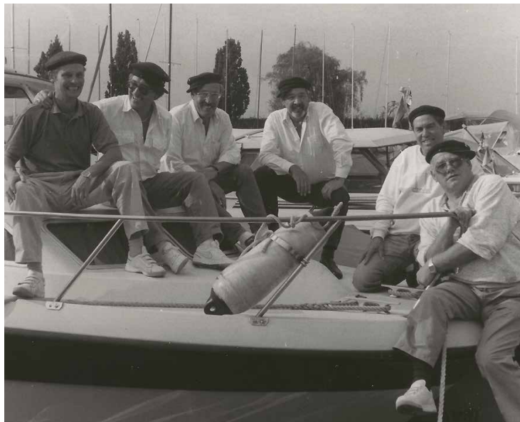
Echte Matrosen 1989

Für das ansprechende Vereinslogo wählte man mit Blau und Schwarz die Farben des Bodensees und der Stadt Bregenz, mit 27. November 1974 war die Clubgründung amtlich. 6,7