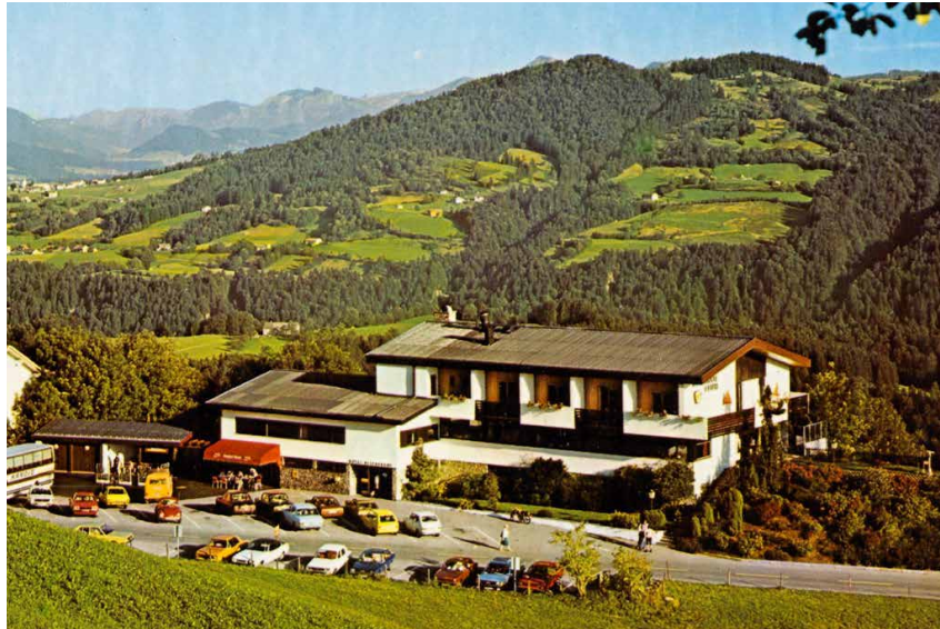
Im Berg Hof Fluh fand die erste Hauptversammlung des neu gegründeten MBC Bregenz statt 1974