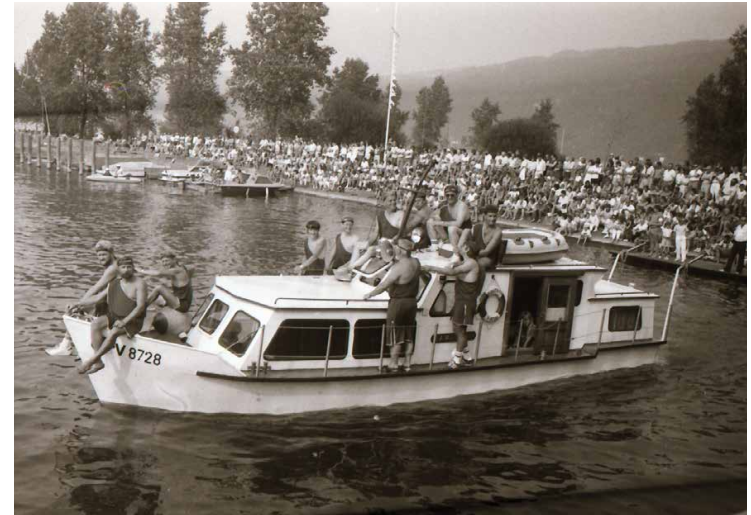
Wasserritterspiele 1985