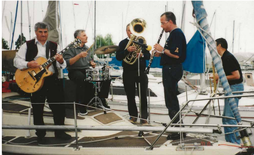
Eröffnung Mooringanlage 2000