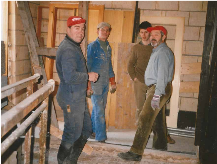
Renovierungsarbeiten 1987