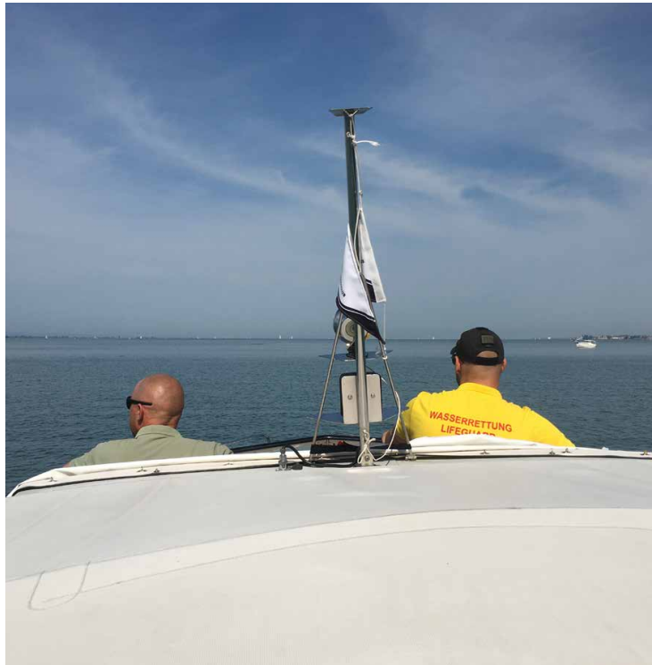
Seediens Begleitschutz der Schwimmer-Seequerung 2019

Vor 40 Jahren wurde von Mitgliedern der Motorbootvereine rund um den Bodensee der freiwillige Seediens ins Leben gerufen. Am Bregenzer Ufer übernahm der MBC diese verantwortungsvolle Tätigkeit! Dazu gehören Umwelt- und Gewässerschutz, Natur- und Tierschutz, Hilfeleistung (Erste Hilfe und Abschleppen) und Beachtung der Vor- und Sturmwarnung und Information an Unvorsichtige und Uninformierte auf dem See. 22