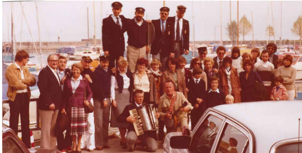
Mitgliederfoto 1976