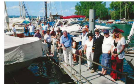
Stegfest 2013