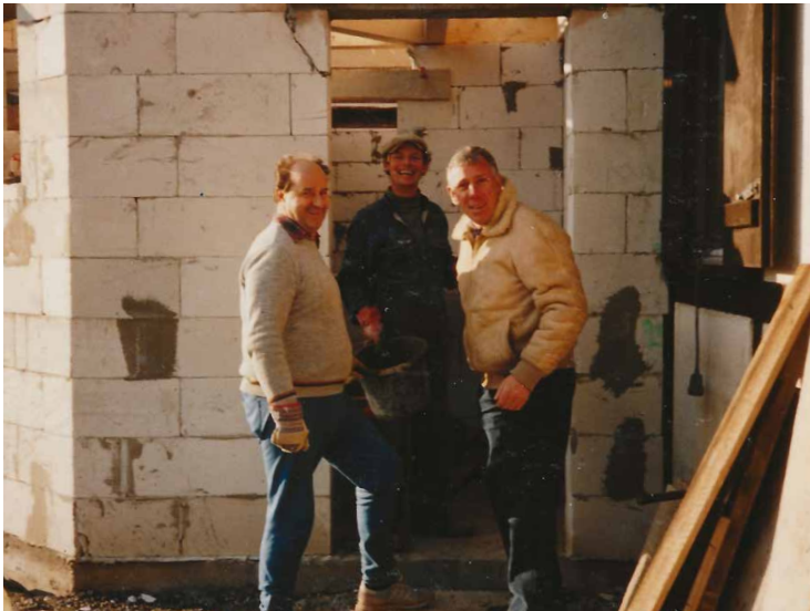
Renovierungsarbeiten 1987