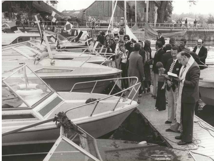
Das erste Ankurbeln mit Bootstaufe und Segnung 1975