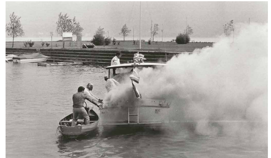
Das Boot wird vom Steg weggeschleppt 1975

Unvergessen sind auch die damaligen Teilnahmen am legendären Bodenseeski-Leistungsabzeichen: Nicht immer trocken verlief die Überquerung des Bodensees zwischen Bregenz und Konstanz und retour auf Wasser-Ski, meistens befestigt am Boot von Kurt Schneeweiß. Besonders Tüchtige schafften die Distanz unglaubliche zwei Mal! 8 9 10