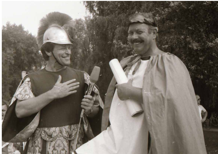
Wasserritterspiele 1985