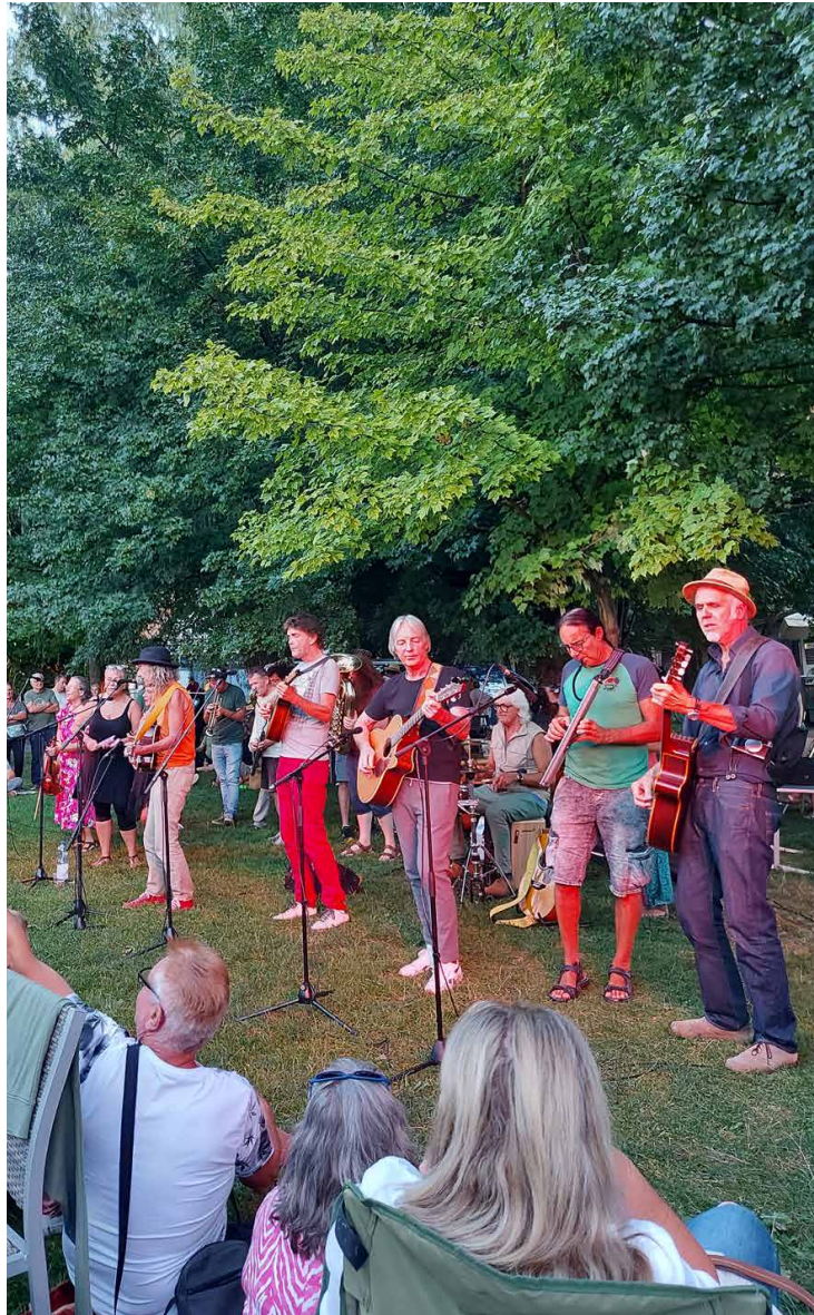
Konzert La Gomera Band 2020

IMMER EINE HANDBREIT WASSER UNTER DEM KIEL UND ALLES GUTE!