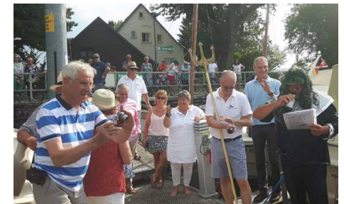
Stegfest 2019