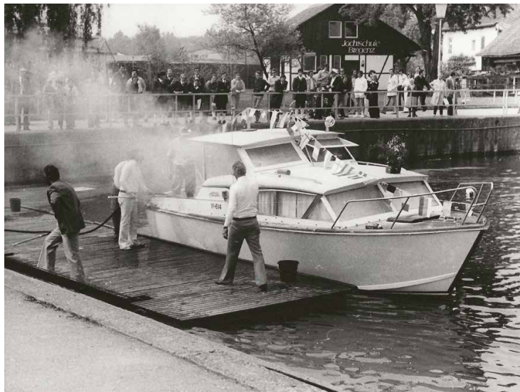
Es war zugleich eine Feuertaufe 1975